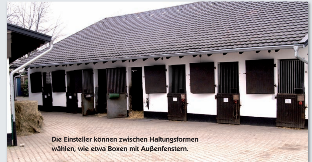
Die Einsteller können zwischen Haltungsformen wählen, wie etwa Boxen mit Außenfenstern.

Rauf und runter gehts auf dem Recklinghäuser Landrücken bei Bottrop. Hier beginnt der Naturpark Hohe Mark: Ideal zum Ausreiten. Zwischen sanften Hügeln finden aber auch großzügige Reitanlagen Platz für ambitionierte Sportler.